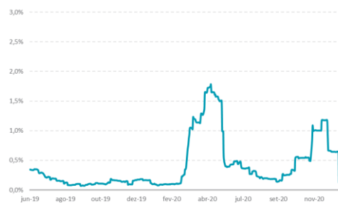
Vol Anualizada % (Média Móvel de 21 dias)

Informações de volatilidade referente a estratégia Titan