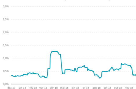
Vol Anualizada % (Média Móvel de 21 dias)